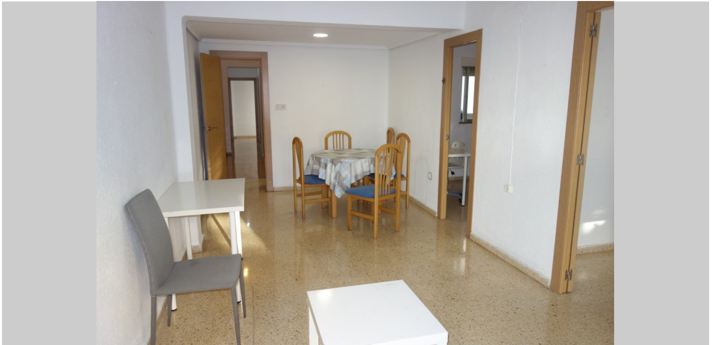
Piso en Foios, zona FOYOS