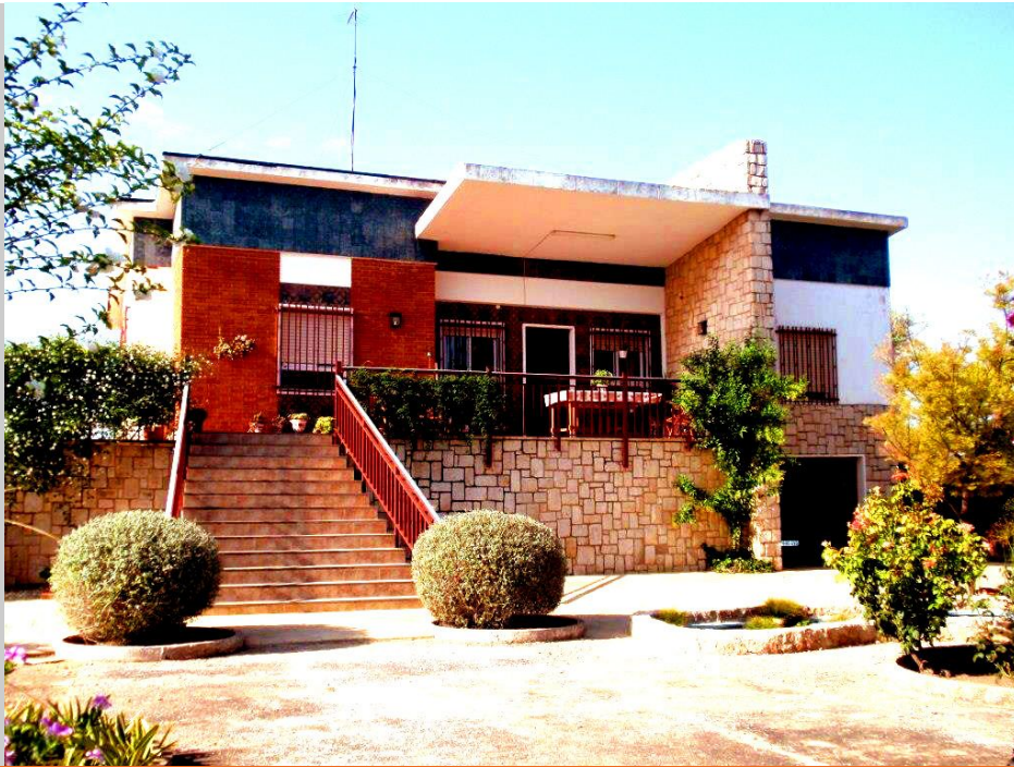
Chalet en Betera, zona Urb. Lloma del Mas