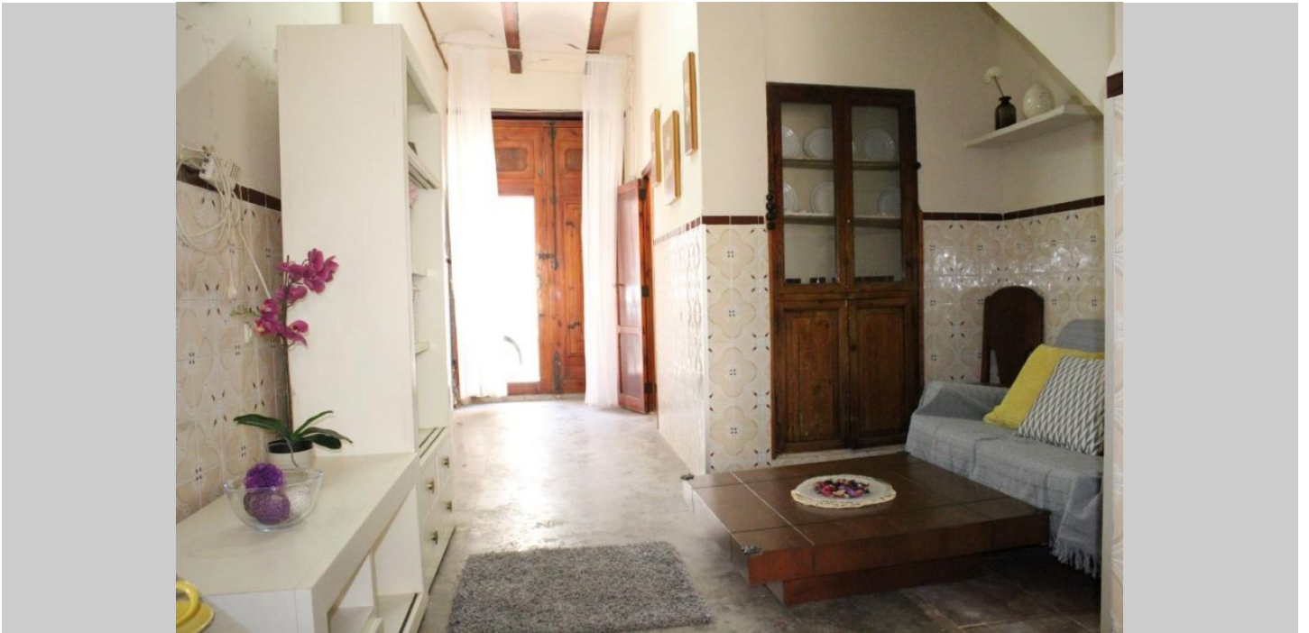
Casa de Pueblo en Massamagrell, zona Massamagrell pueblo