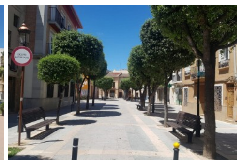
Pisos en Alboraya, Alboraya Centro