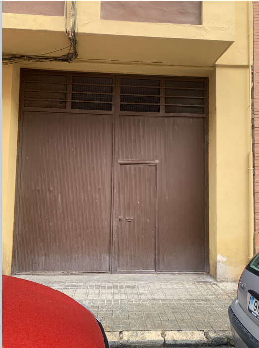
Local en planta baja